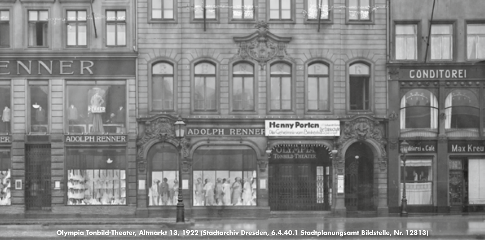
Olympia Tonbild-Theater, Altmarkt 13, 1922