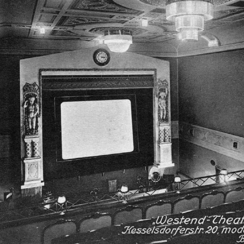
„Westend-Theater Kesselsdorferstr. 20, modern B