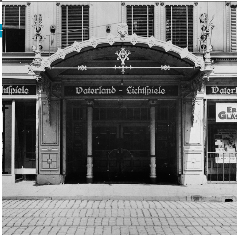
Die Vaterland-Lichtspiele, Foto 1920 (Deutsche Fotothek)

Der unter Mitwirkung von Bertolt Brecht (Drehbuch) und Hanns Eisler (Musik) entstandene Film gilt als Meilenstein des Proletarischen Films. Im Mai 1932 in Moskau uraufgeführt, kam »Kuhle Wampe« nur in einer zensierten Fassung in die deutschen Kinos und wurde u. a. bereits im Juli 1932 in den Dresdner Vaterland-Lichtspielen am Freiburger Platz gezeigt. In der NS-Zeit wurde der Film im März 1933 verboten.